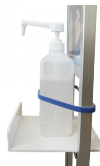
重みのあるボトルをご使用の際はテーブルの奥側に固定して頂く事を推奨致します。